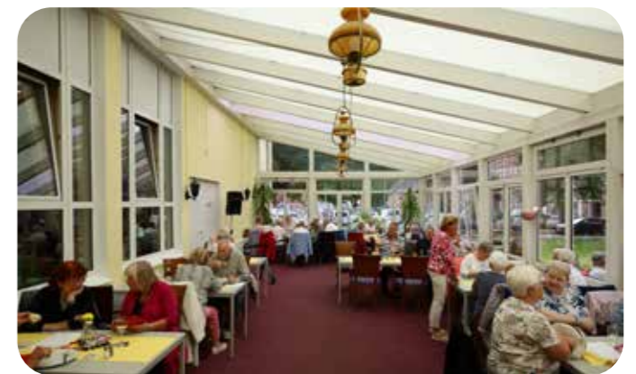
Auch im Wintergarten kehrte die sommerliche Stimmung Einzug ein.