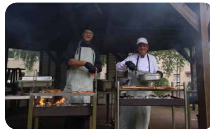
Die Grillmeister sorgten für würzigen Grillgenuss.