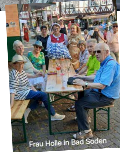
Frau Holle in Bad Soden