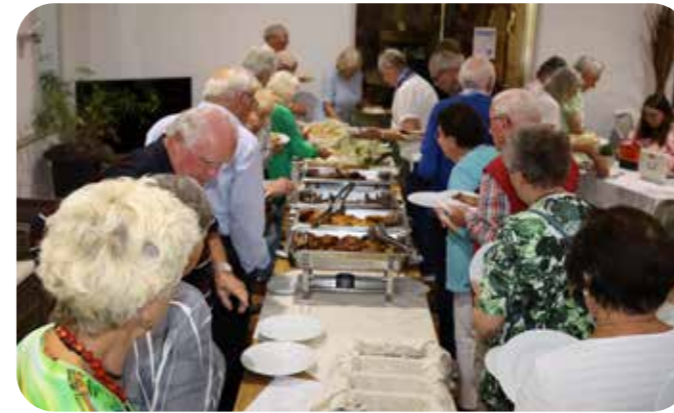
Bei der vielfältigen Auswahl am Grillbuffet war jeden Geschmack etwas dabei.