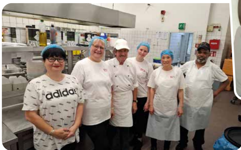
Das BEW-Küchenteam sorgte für das leibliche Wohl der Gäste