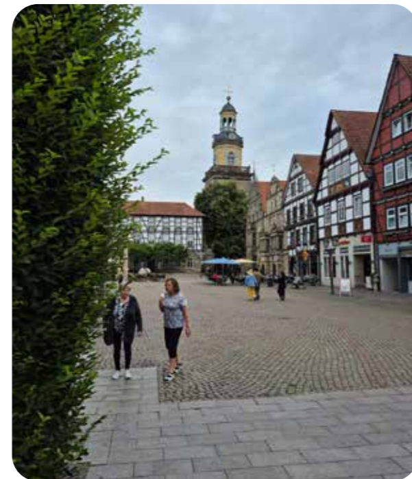
Ein kleiner Ausflug