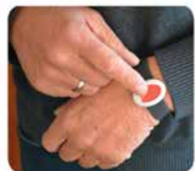
Der Funksender stellt eine Verbindung zum Notrufgerät her.

Das System ist ein wichtiges Sicherheitselement für ältere Menschen, das Ihnen ermöglicht, im Notfall schnell Hilfe zu holen, ohne auf andere angewiesen zu sein. Bei einem Notfall drückt der Nutzer einfach die Notruftaste am Sender. Dadurch wird ein Signal an die Notrufzentrale, die täglich 24 Stunden besetzt ist, gesendet und eine Sprechverbindung hergestellt. Die Mitarbeiter der Notrufzentrale nehmen dann Kontakt mit dem Nutzer auf und alarmieren den beauftragten Pflegedienst, bei dem für diesen Zweck der Haus- bzw. Wohnungsschlüssel hinterlegt ist. Falls notwendig, ruft die Pflegekraft den Rettungsdienst und den Notarzt. Die vom Kunden angegebenen Angehörigen werden umgehend