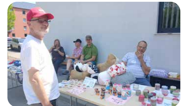
Die Kunstgruppe verkaufte selbsthergestellte Seifen und Kerzen