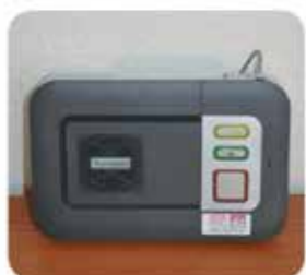
Der Notruf geht in der Notrufzentrale ein. Dort tritt ein/e Mitarbeiter/in mit Ihnen über die Freisprechanlage in Sprechkontakt.