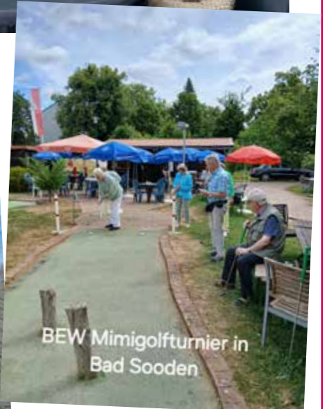
BEW Mimigolfturnier in Bad Sooden