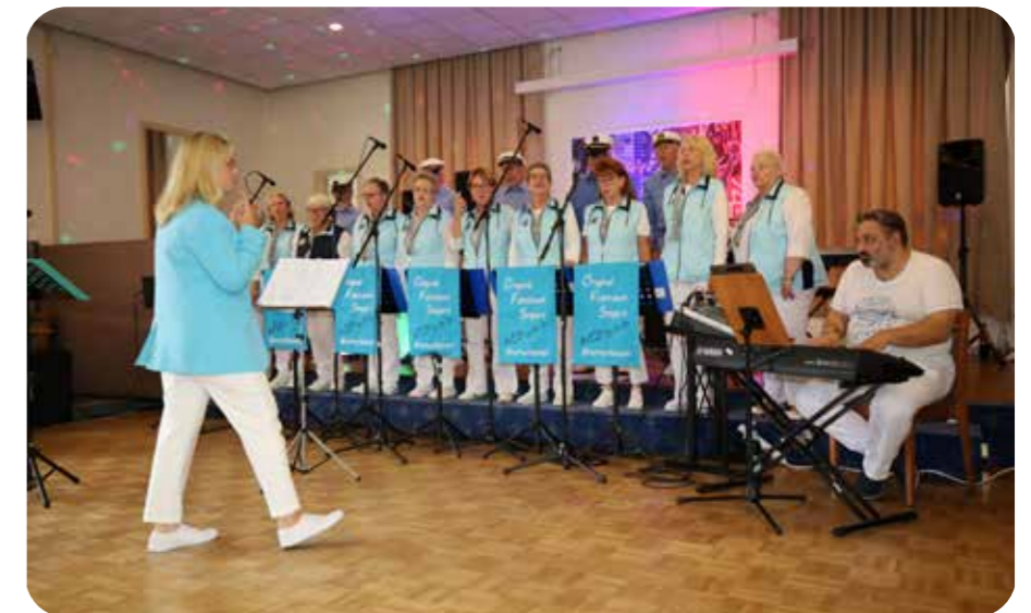
Die Original Fishtown-Singers stimmten schon mal auf die bevorstehende Sail ein.