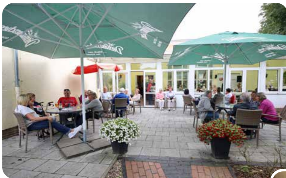
Der strömende Regen blieb aus, die Sommerterrasse füllte sich.