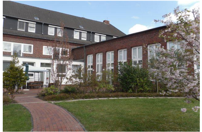
Garten / Terrasse

Es steht ein Gemeinschaftsraum für gemeinsame Mahlzeiten, Gespräche, Gymnastik und Spielnachmittage zur Verfügung.